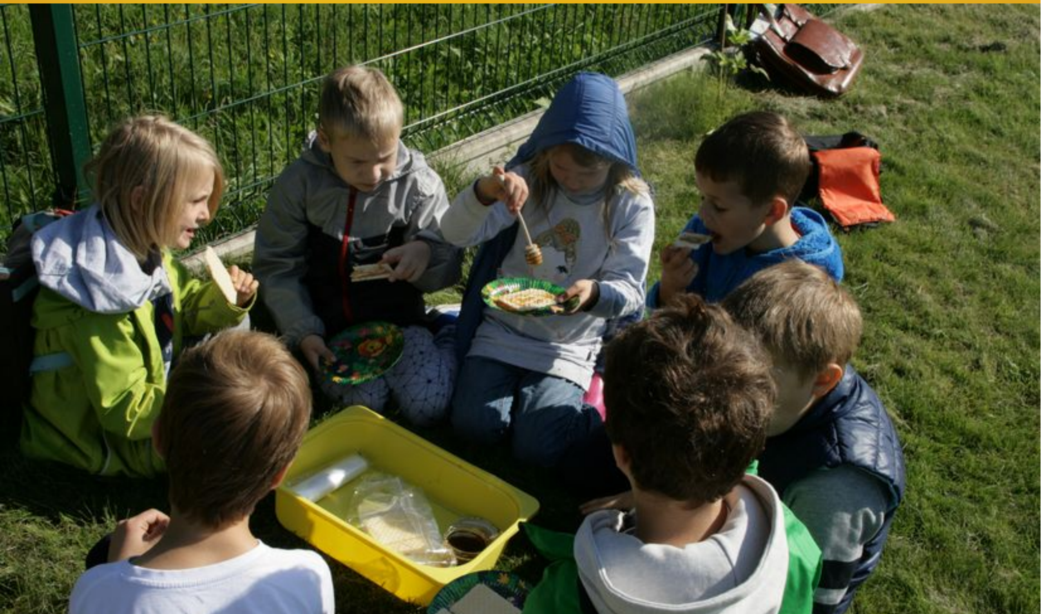
Dzieci są zachwycone smakiem miodu pozyskanego na terenie Śląskiego Ogrodu Botanicznego.