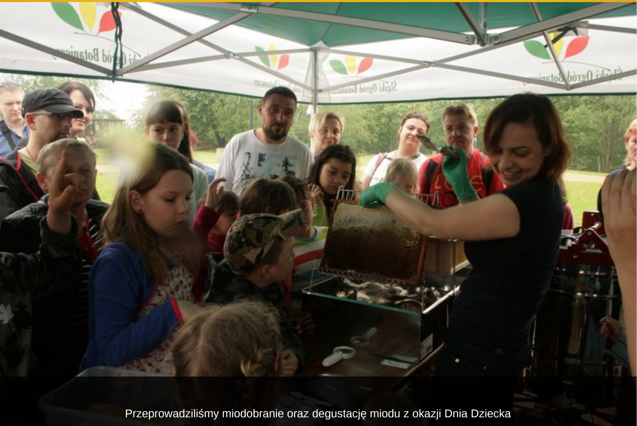
Przeprowadziliśmy miodobranie oraz degustację miodu z okazji Dnia Dziecka