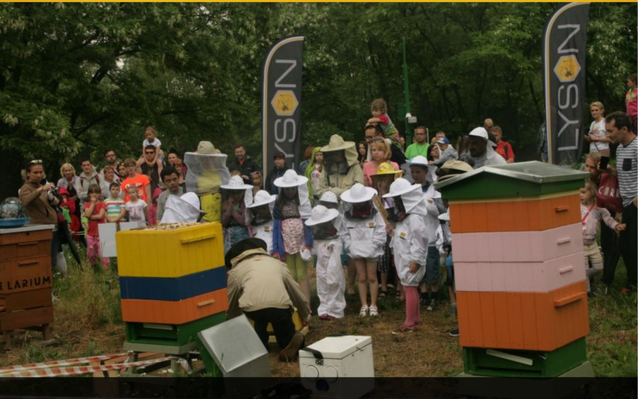
Kolejne grupy oczekują na podejście do uli w trakcie prowadzonych zajęć